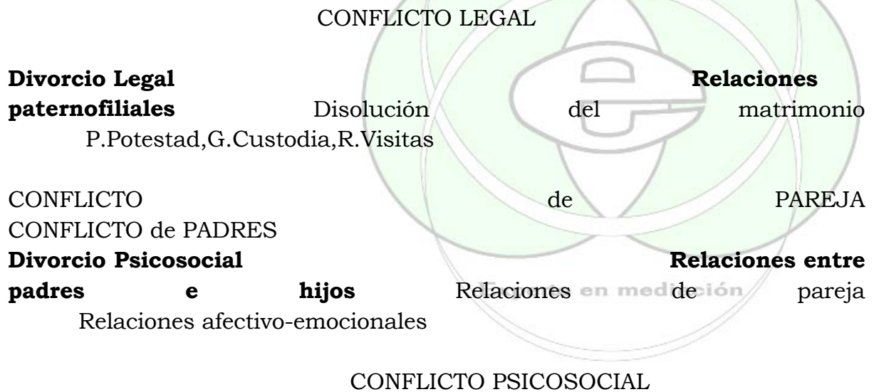
Figura I. Dimensiones del conflicto psicojurídico.

La patria potestad, la guarda y custodia y el régimen de visitas son conceptos legales que pasan a formar parte del vocabulario y de la vida familiar tras la ruptura. Cuando los padres no han podido ponerse de acuerdo sobre la forma de regular la continuidad de las relaciones con sus hijos, derivan al juez la responsabilidad sobre una decisión tan crucial. Se da la